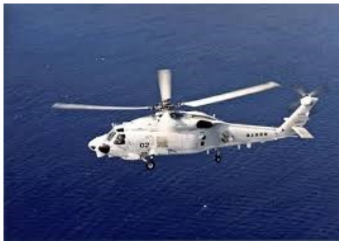
図.1 SH60K 哨戒ヘリコプター

A: 防衛省の発表によれば、2024年4月20日午後10時38分ごろ、伊豆諸島の鳥島の沖合でSH60K哨戒ヘリコプター1機の通信が途絶え、そのおよそ1分後にこの機体から緊急信号を受信したということです。そのおよそ25分後の午後11時4分ごろ、同じ海域で別のSH60K哨戒ヘリコプター1機の通信が途絶えていました。現場周辺では機体の一部とみられるものが確認され、2機は墜落したとみられています。2機にはそれぞれ4人、合わせて8人が搭乗していました。このうち1人は救助されましたが、その後に死亡が確認されました。SH60K哨戒ヘリコプターは、主に護衛艦に搭載されて運用され、2機は潜水艦を捜索する夜間の訓練を行っていました。2機の所属は長崎県の大村航空基地と徳島県の小松島航空基地です。海上自衛隊によれば、現場周辺に他国の航空機や艦艇などではなく、「他国の関与はないと考えるのが適切だと思う」とされています。防衛省は墜落した原因を調べるとともに、護衛艦と航空機で現場周辺の捜索を続けています。