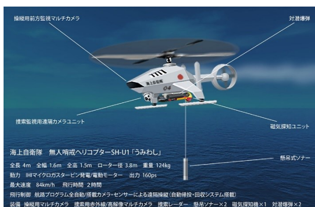
図. 3 無人対潜哨戒ヘリコプター

A: もちろん、あります。無人対潜哨戒ヘリコプターが研究されています。ですが、実戦に本当に適しているかどうかは未知数です。有人による対潜哨戒ヘリコプターの訓練はまだなくせません。訓練時の事故をなくすためにも、海上自衛隊には本物の CRM 訓練を導入することをお勧めします。