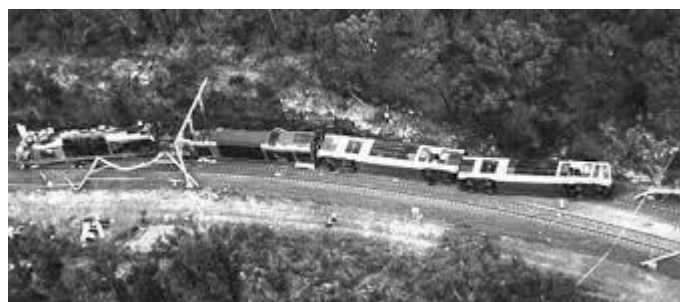
図. 4 ウォーターフォール駅近くの脱線事故

A: 酷似した脱線事故がオーストラリアで起きています。2003年1月31日に、シドニーのウォーターフォール駅近くで列車が脱線して、運転士と乗客6人が死亡しました。事故調査では、運転士が速度制限時速60kmのカーブに時速117kmで進入したことが原因とされています。