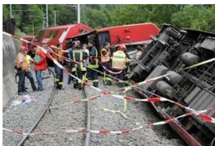
図.6 スイスの氷河特急の脱線事故

Q: JR 西や他の鉄道会社はこの事故の対策として自動列車停止装置 (ATS: Automatic Train Stop) の設置を拡充していますが、この対策をどう思いますか？