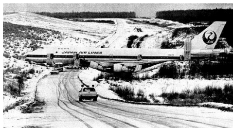
図. 3 誘導路から滑落した JAL422 便

A: 航空機でも同じ現象が起きることがあり、事故の原因になっています。ボーイング 747 の5本の降着装置 (Landing Gear) からなる脚構造も不静定構造です。そのため、機首降着装置 (Nose Gear) が浮き上がって機体が滑走路や誘導路から逸脱するという事故が起きています。JAL では、1975年に米国アムステルダム空港で JAL422 便 (ボーイング 747-200) が積雪した誘導路から滑落して大破するという事故が起きています。機首降着装置が浮いて雪道で方向制御 (Steering) ができなくなったためと考えられます。事故調査では「パイロットによる逆噴射装置の操作ミスが原因」とされて、脚の空気バネの状態は調査の対象になりませんでした。