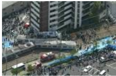
図.1 脱線、大破した JR 西快速列車 5418M

A: 2005年4月25日午前9時18分ごろ、兵庫県尼崎市にある福知山線塚口駅-尼崎駅間の右カーブ（曲率半径304m）で、宝塚発 JR 東西線・片町線（学研都市線）経由同志社前行き上り快速の前5両が脱線しました。うち前4両は線路から完全に逸脱、先頭の2両は線路脇の分譲マンションに激突して大破しました。この事故により106名の乗客と運転士1名が死亡しました。さらに、562名の乗客と付近を通行していた1名が負傷しました。航空・鉄道事故調査委員会（現在の運輸安全委員会の前身）は報告書の中で、原因を「脱線した列車がブレーキをかける操作の遅れにより、半径304mの右カーブに時速約116kmで進入し、1両目が外へ転倒するように脱線、続いて後続車両も脱線した」と結論づけました。